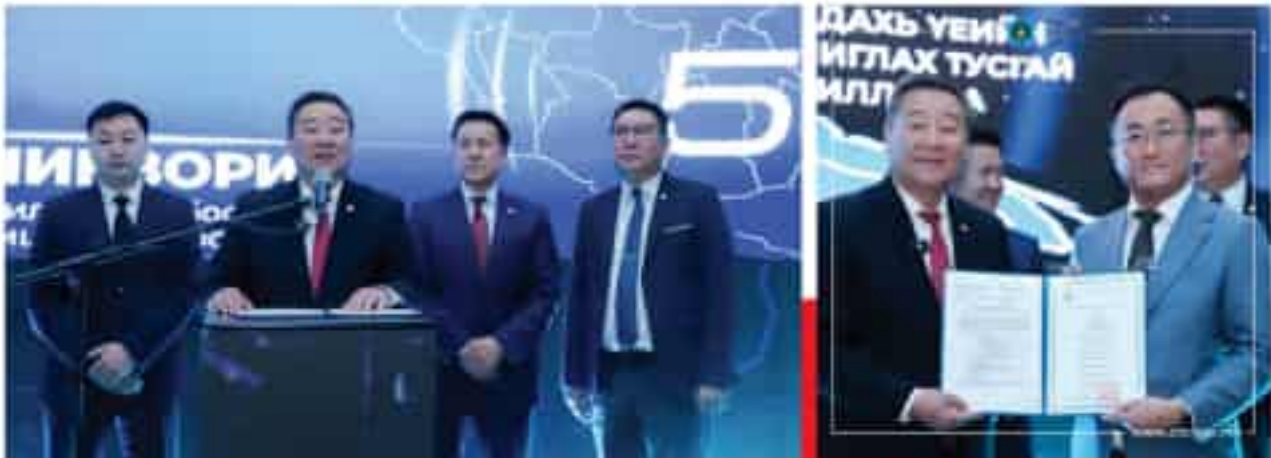
Мобиком Корпораци ХХК

Монгол Улс 5G технологид ашиглах радио давтамжийг олон улсын хэмжээнд 2023 онд баталгаажуулж, бодлого зохицуулалтын орчныг шат дараатайгаар бүрдүүлсэн бөгөөд 2025 оны 05 дугаар сарын 15 өдөр албан ёсоор 5G сүлжээг нэвтрүүлж байна.