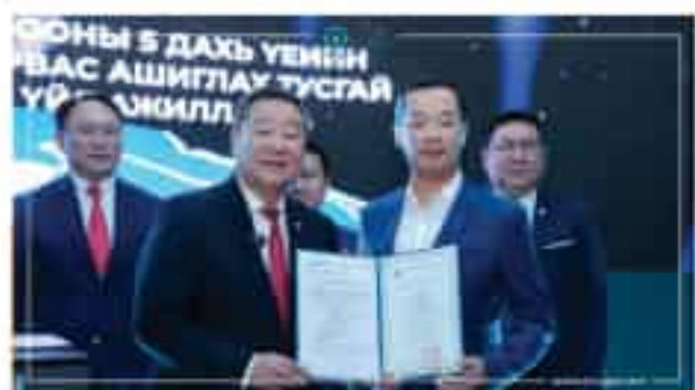
Жи Мобайл ХХК